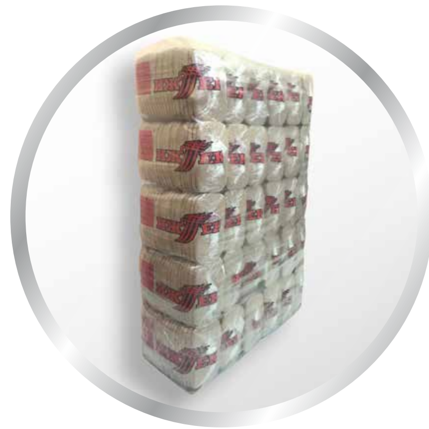
МЕШОК 6000 ПАР