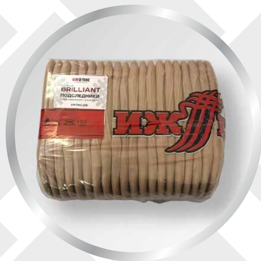
БЛОК 200 ПАР